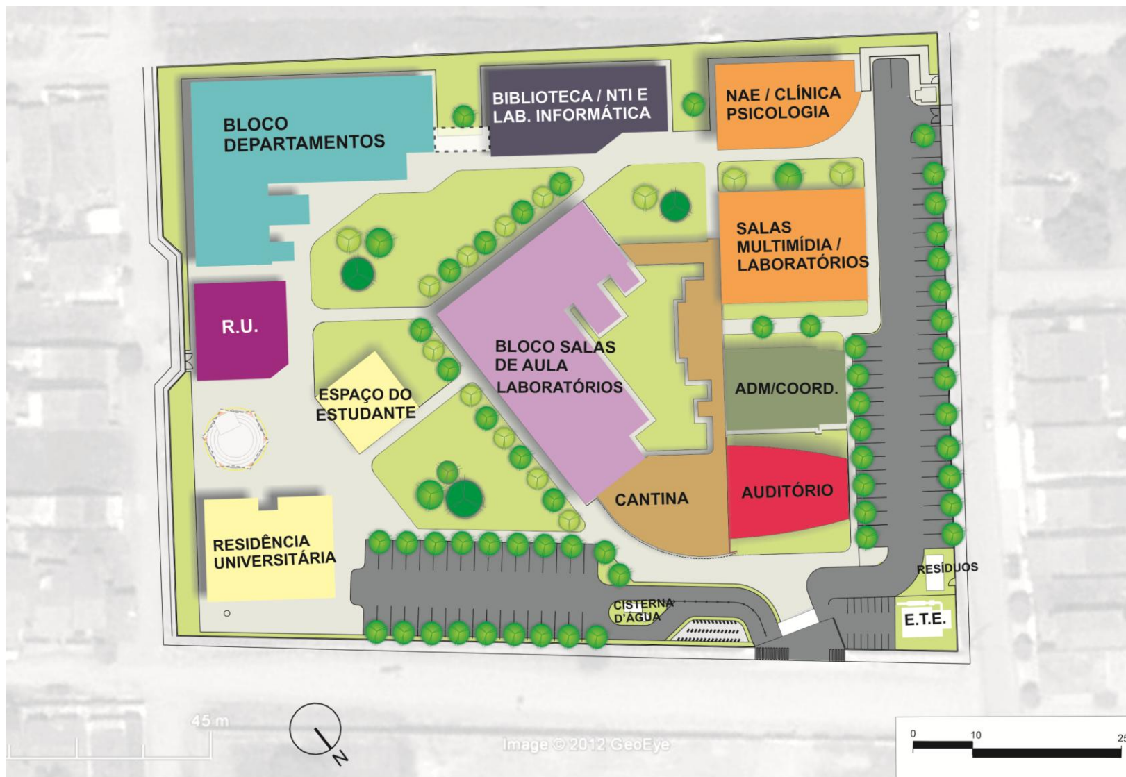
Figura 11 – Mapa de ocupação plena da Unidade Palmeira dos Índios.