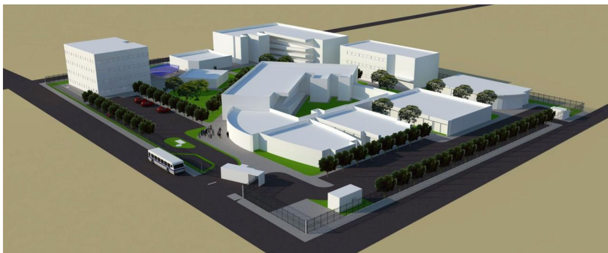
Figura 12 – Maquete eletrônica – vista da Unidade Palmeira dos Índios – Acesso principal, Núcleo Central, Auditório e Residência Universitária (à esquerda).