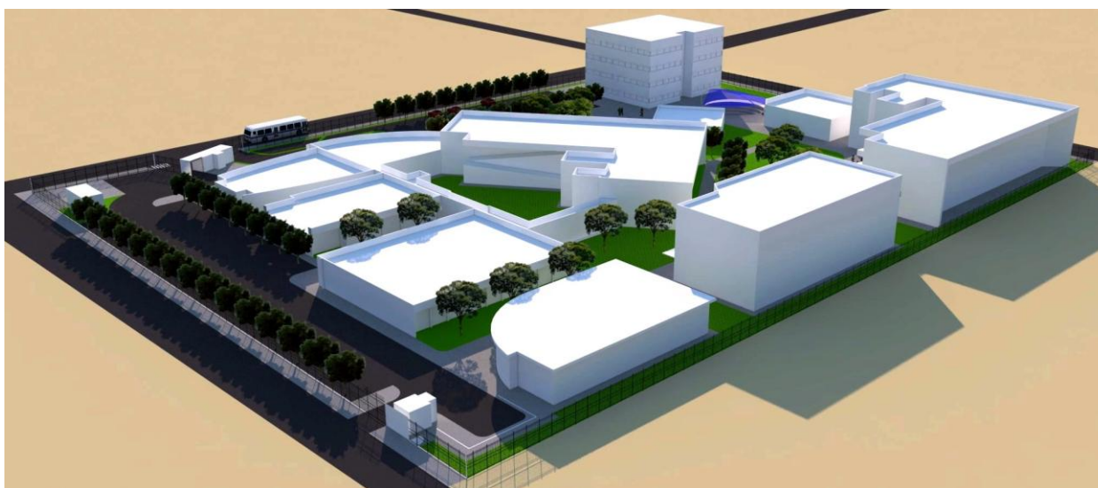
Figura 13 - Maquete eletrônica – vista da Unidade Palmeira dos Índios – acesso posterior – (da esquerda para direita) Clínica de Psicologia, Biblioteca, NTI e Bloco de Departamentos de Cursos.